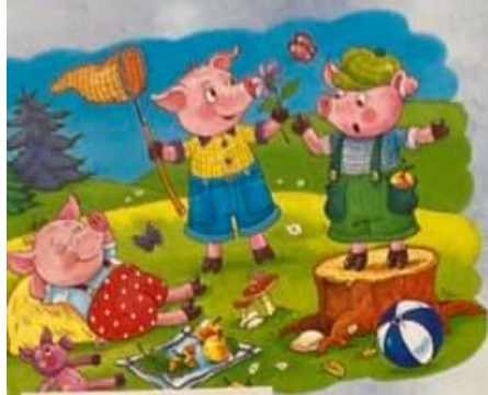
1. Dvě prasátka jsou líná a třetí je pracovitě.