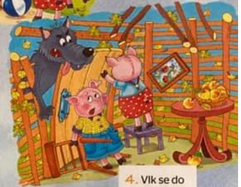
4. Vlk se do domku opřel a takhle to dopadlo.