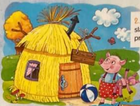
2. Tohle je dům ze slámy, postavilo si ho první prasátko.