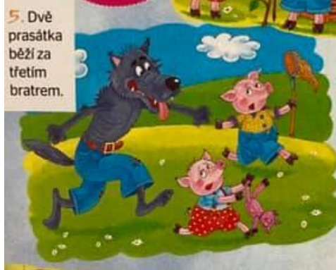
5. Dvě prasátka běží za třetím bratrem.