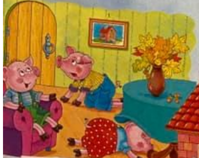
7. Zachráněná prasátka tu našla útočiště.