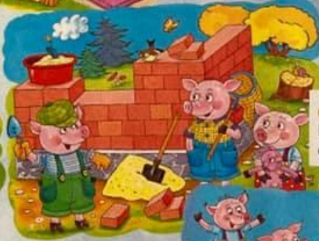
6. Tím bratrem, který si postavil domek z cihel.