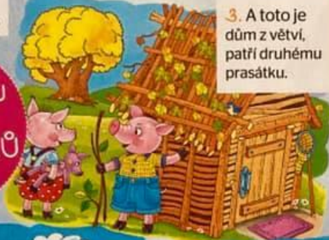
3. A toto je dům z větví, patří druhému prasátku.