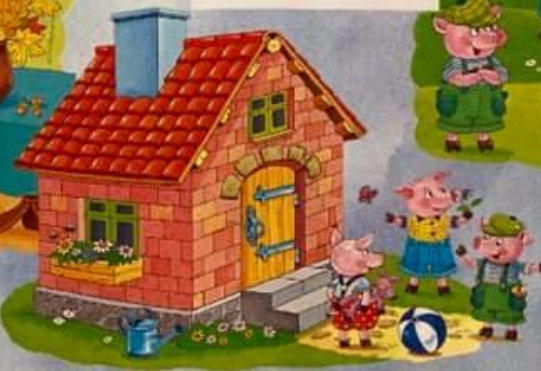
9. Prasátka se ho už nemusela bát.